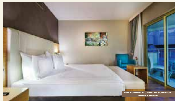
1-ая КОМНАТА CAMELIA SUPERIOR FAMILY ROOM