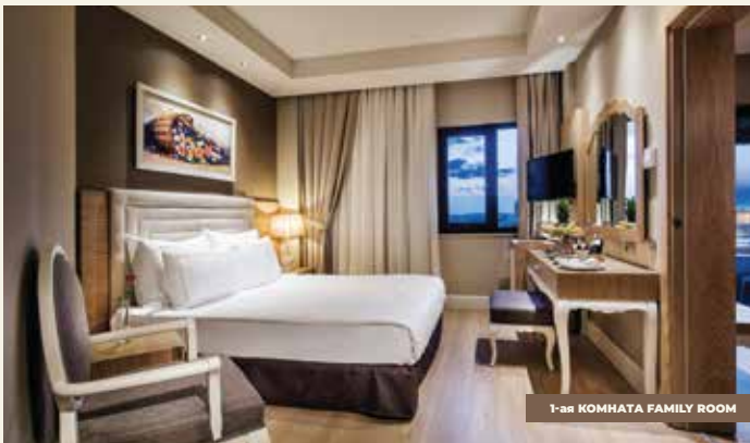
1-ая КОМНАТА FAMILY ROOM