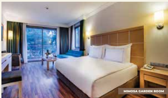
MIMOSA GARDEN ROOM

· Высокоскоростной интернет · Зеркало для макияжа и бритья · Косметика в ванной комнате · LED TV · Мини бар · Подставка для чемодана · Сейф · Тапочки · Телефон · Фен · Халат · VRF система кондиционирования · Чайник