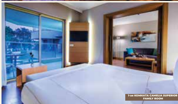
1-ая КОМНАТА CAMELIA SUPERIOR FAMILY ROOM