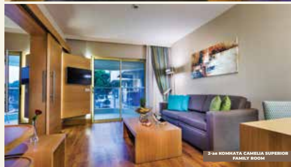
2-ая КОМНАТА CAMELIA SUPERIOR FAMILY ROOM