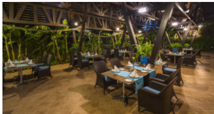
POSEIDON A'LA CARTE РЕСТОРАН