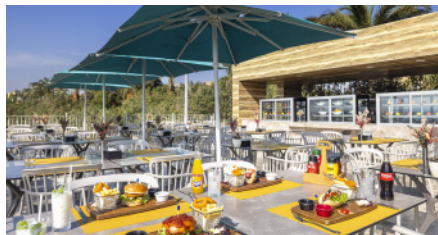
BBQ A'LA CARTE РЕСТОРАН