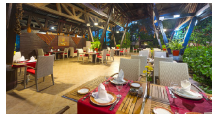
DAFNE A LA CARTE РЕСТОРАН