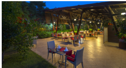
DAFNE A LA CARTE РЕСТОРАН