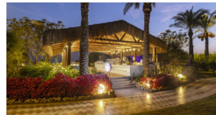
NEYZEN КАФЕ & РЕСТОРАН