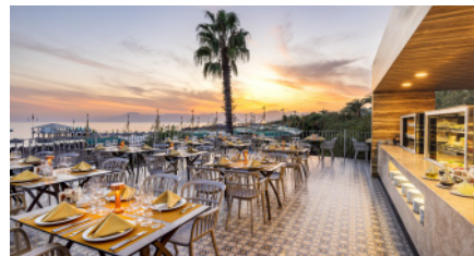
BBQ A'LA CARTE РЕСТОРАН