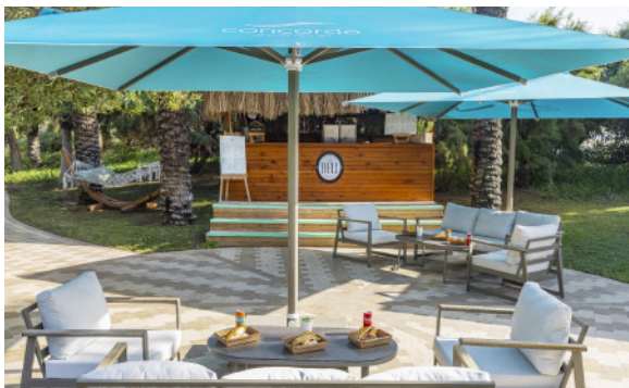
THE DELI TOAST (Тосты в ассортименте)