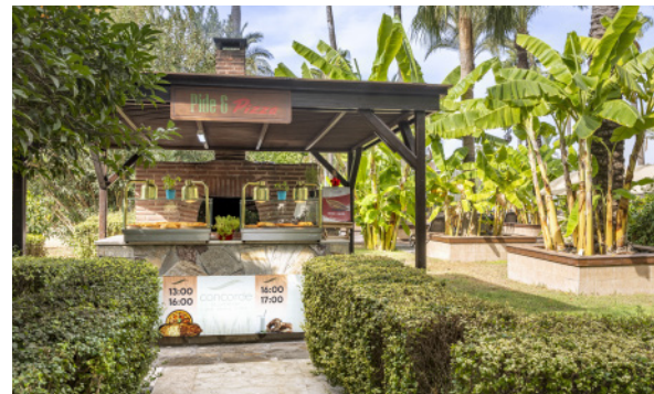
GARDEN GRILL (Гриль в ассортименте)