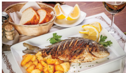
POSEIDON A'LA CARTE РЕСТОРАН