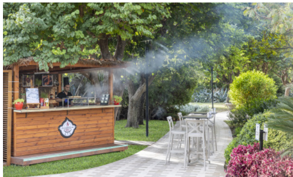
THE FRY FACTORY (Картофель Фри)