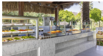
NEYZEN КАФЕ & РЕСТОРАН